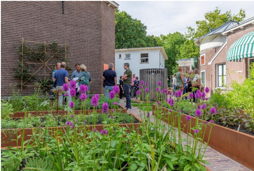
Opening nieuwe tuin museum & sterrenwacht Sonnenborgh in juni 2022.