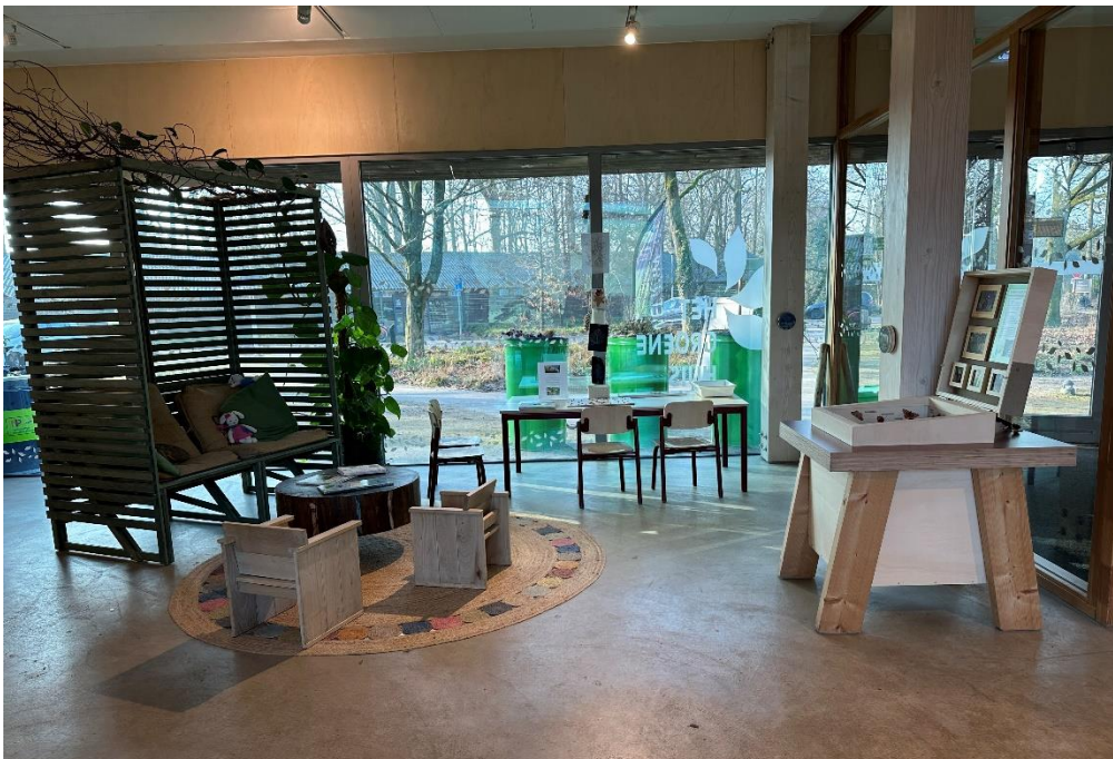
Figuur 4 Werkhoek in de expositierimte