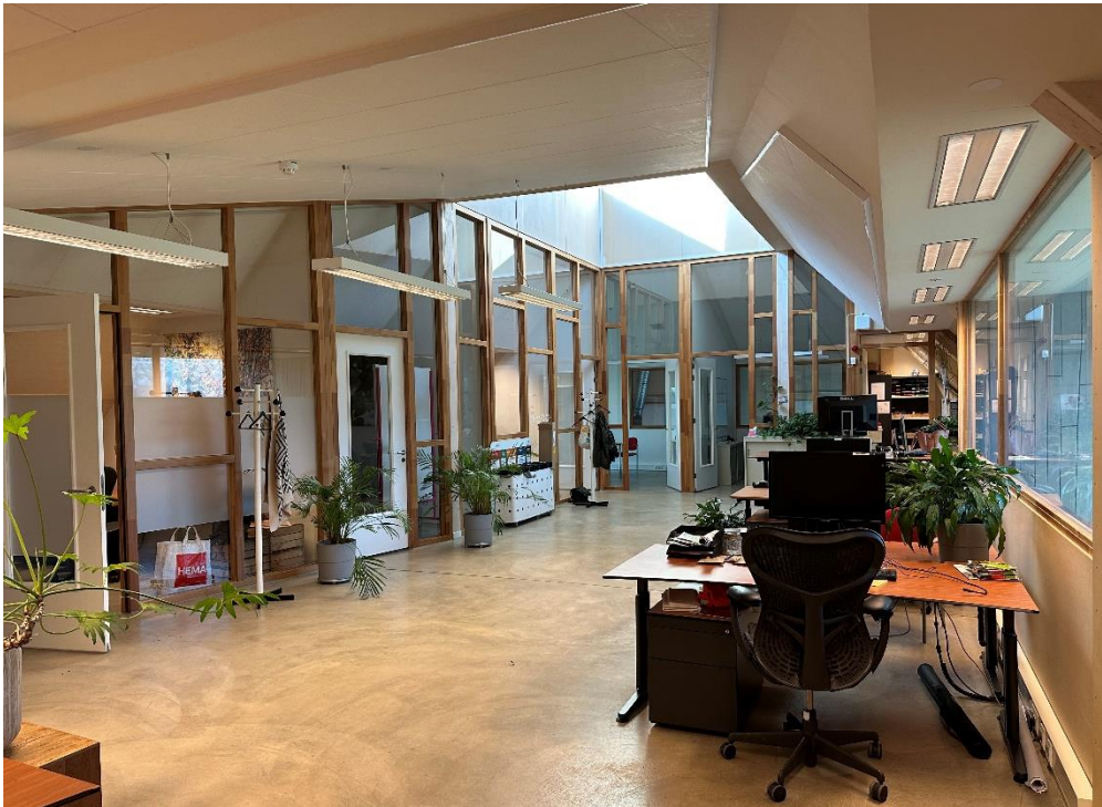
Figuur 1 De werkzolder met flex bureau's van Het Groene Huis

Foto's van de beschikbare werkruimtes in Het Groene Huis: