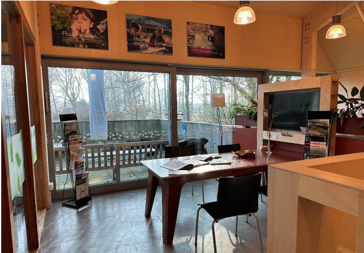
Figuur 5 Werkruiimte Vide met grote tafel