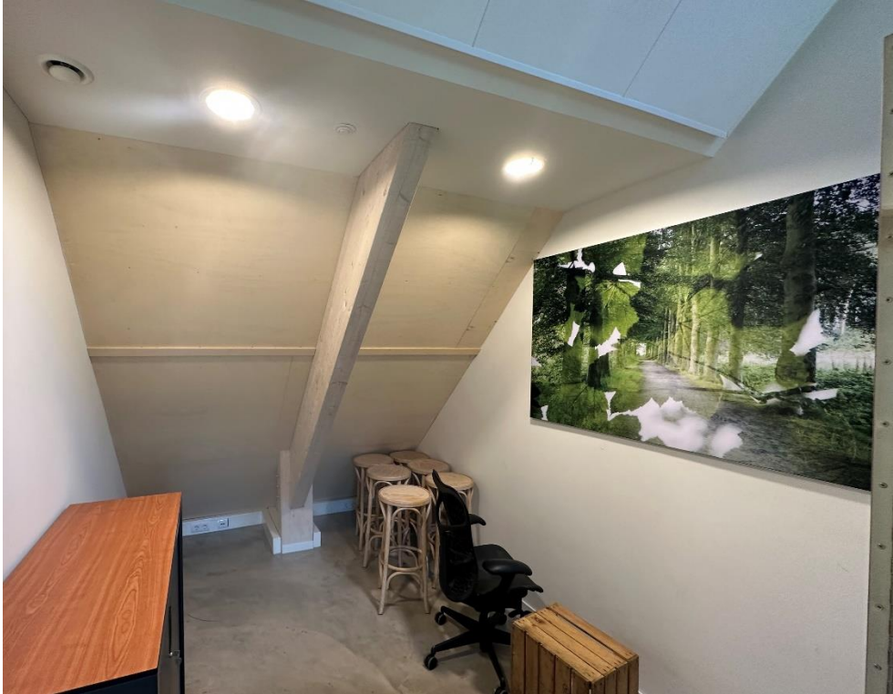
Figuur 3 Werkrimte zonder bureau